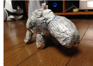
(新聞紙で作られた牛ロボット)

第1回「いせへボコン」を開催します！ 出場者を募集しております！技術力の低い方、素人の方、 飽きっぽい方、自作のロボットを持って伊勢で戦ってみませんか？ まともに動かなくてもOK！だだくさ(伊勢弁)な出来栄でもOK！ へばいロボットこそ本大会では値打ちがあります。 皆様のご参加をお待ちしています！